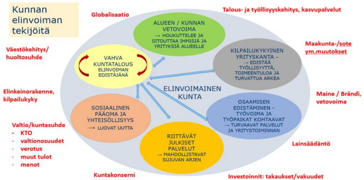
Kuvio 5. Elinvoiman eväät: